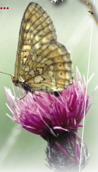
Le Damier de la Succise se distingue des autres espèces de Damiers par une série complète de points noirs sur les ailes postérieures.

En septembre 2006, un premier diagnostic écologique a été réalisé sur une prairie humide de Rudeau-Ladosse abritant une petite population de Damiers. Ce travail a consisté à rechercher les nids de chenilles et à évaluer la densité de Succises par carrés de 10m de côtés. En parallèle, des mesures de gestion adaptées ont été définies en partenariat avec l'association "le Rocher de Guyenne", propriétaire de la parcelle. Le suivi régulier de ce site témoin permettra de s'assurer de l'efficacité des mesures de conservation ainsi mises en place sur la population de Damiers et de sa plante hôte, la Succise.