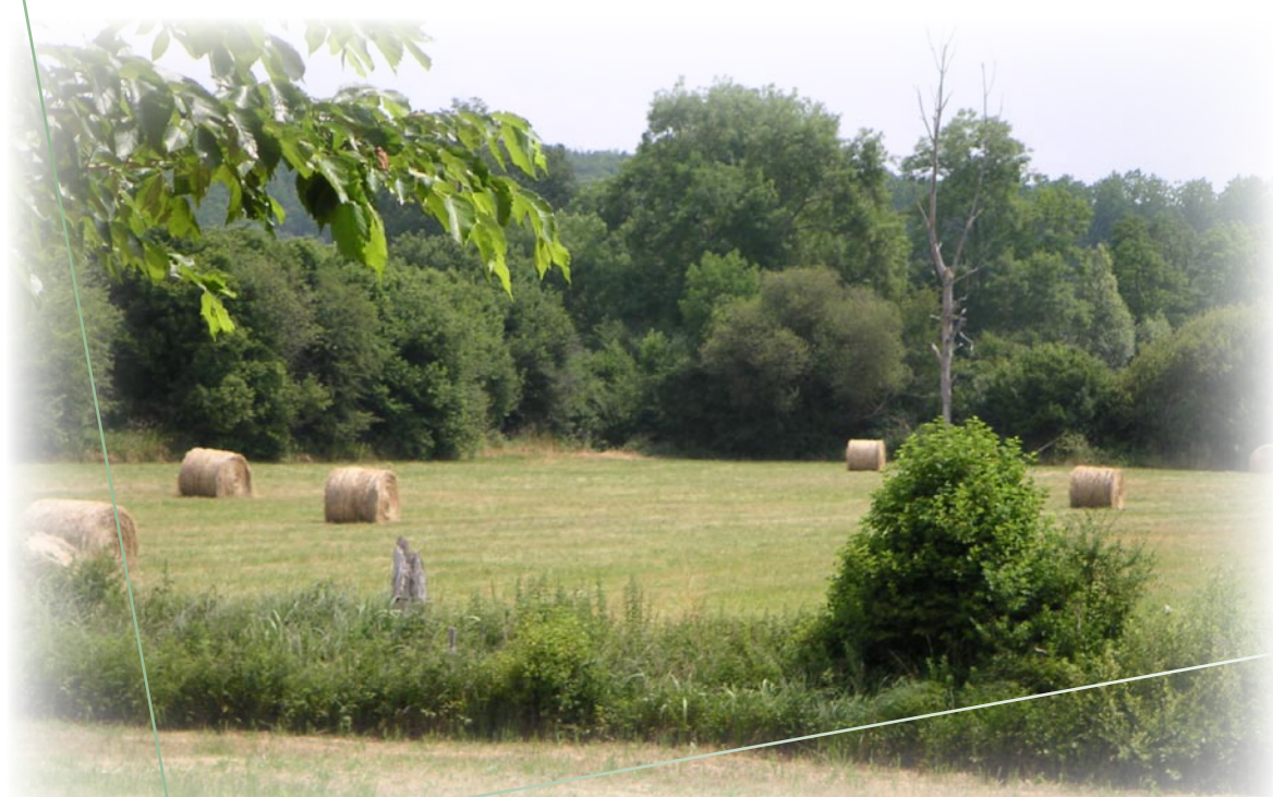
Prairie maigre de fauche, Lavergne, Saint-Sulpice-de-Mareuil