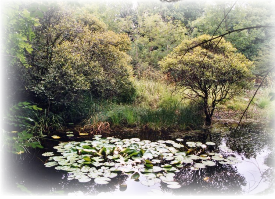
Fosse d'extraction de tourbe