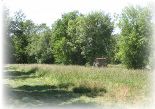
Prairie de fauche, Vendôvre

sensible à la protection de la Nature et les mesures de conservation ne me demandaient pas de changer trop mes pratiques. Sur le reste de l'exploitation je souhaitais diminuer les surfaces en céréales et augmenter les surfaces en herbe et luzerne. Le fait d'être dans un site Natura 2000 a certainement facilité le passage de mon dossier de demandes d'aides. Personnellement, je vois Natura 2000 comme un atout et non pas comme une contrainte ».